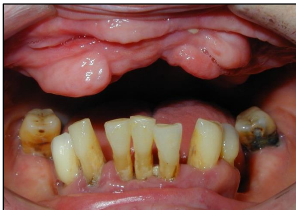
dutina ústní před preprotetickou přípravou

Úprava protézniho lože je nutná v případě např. duplicitního hřebene, vlnitého hřebene, vysokého úponu sublingvální uzdičky apod.