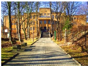
budova Palachova 35